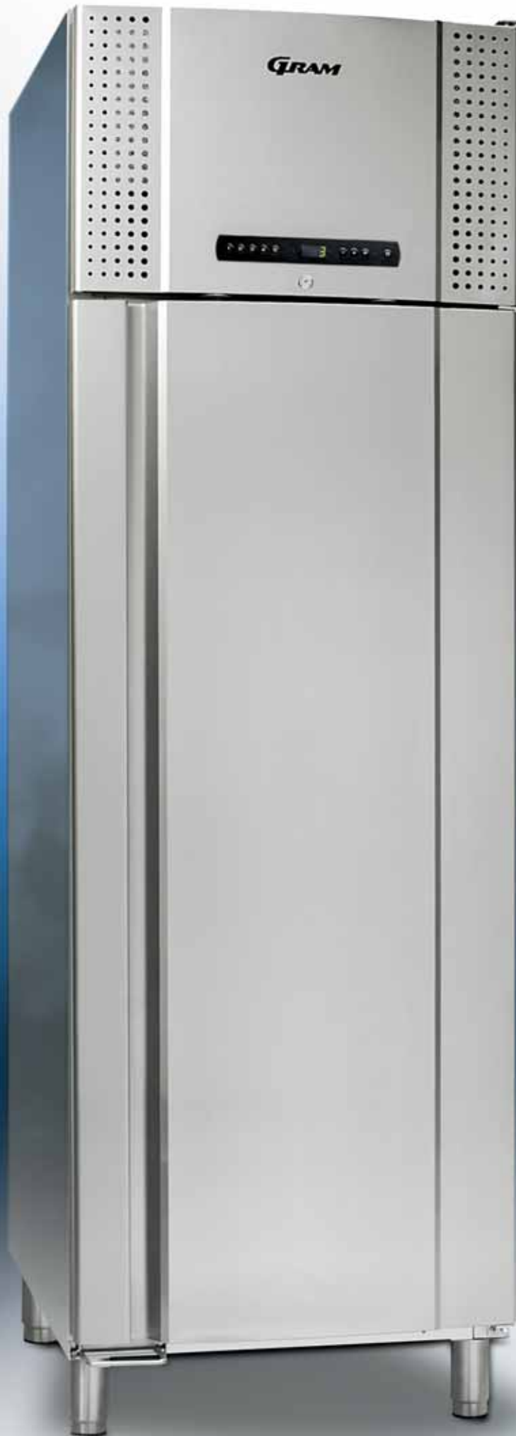
PLUS 660 CX