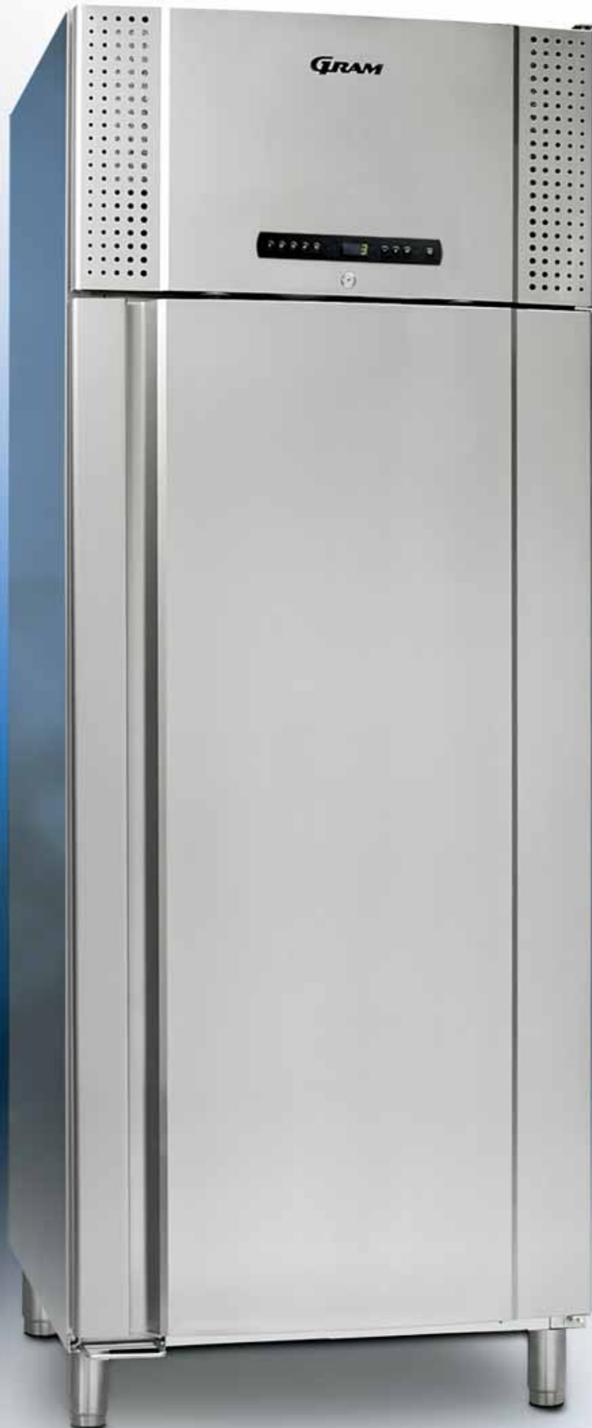
TWIN 660 CX