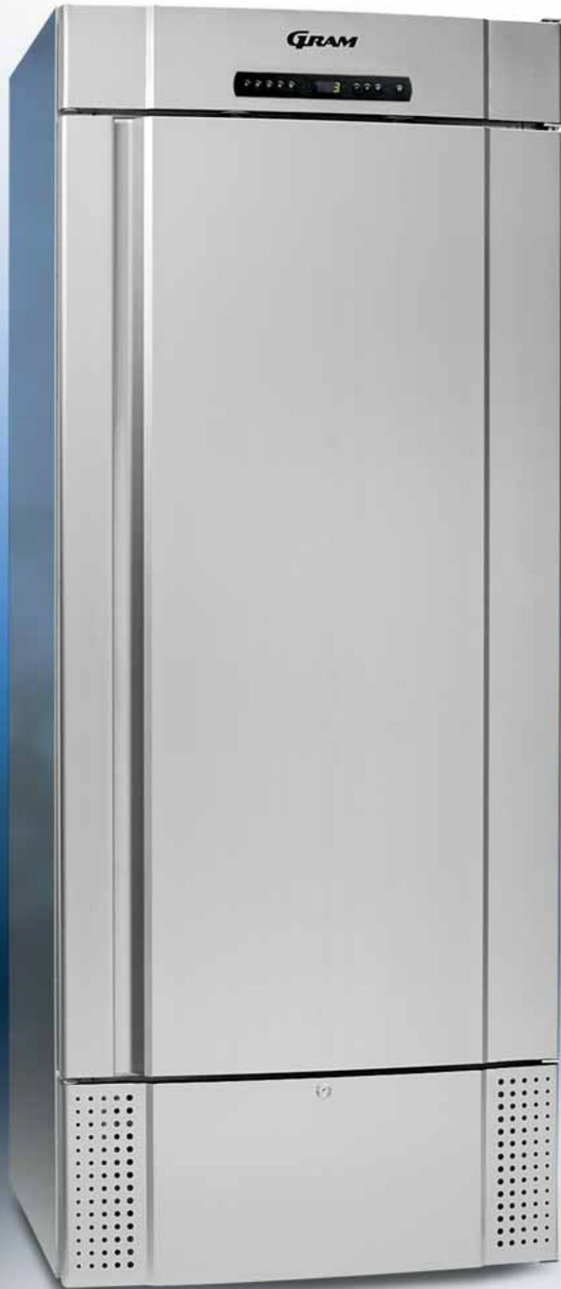
MIDI 625 CX