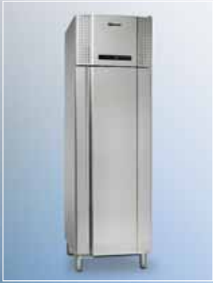
EURO 500 CX