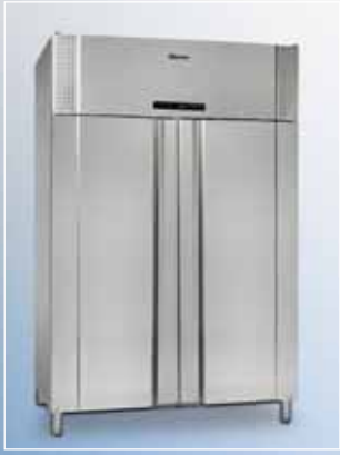
PLUS 1400 CX