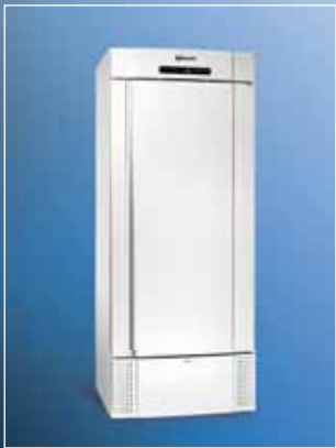
MIDI 625 LS