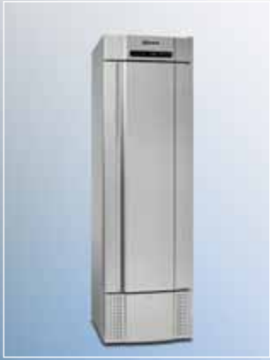
MIDI 425 CX